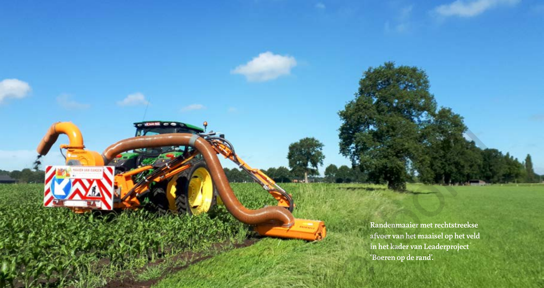
Randenmaaier met rechtstreekse afvoer van het maaisel op het veld in het kader van Leaderproject 'Boeren op de rand'.