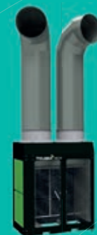
Tolsma Air 50 Ventilatoren