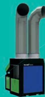
Tolsma Cool 50 Ventilatoren en koelen