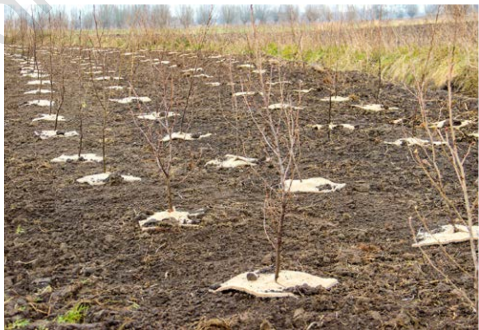
Een pas aangeplante houtkant. Wat mulch, een jutering of gewoon een stuk karton waarmee je de bodem afdekt voorkomt onkruid en houdt de bodem langer vochtig.